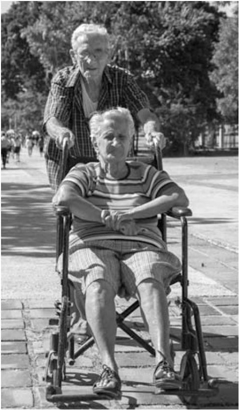
Muchos llegaron porque sí, al corazón de la Plaza.