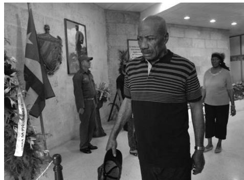
Marbello lleva el mayor de los dolores. En la Sierra Maestra cargó al Líder en el peso de su mochila.