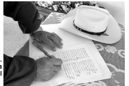
Con el corazón y con las manos. La mejor de las cosechas, para quien nos sigue cultivando el espíritu.