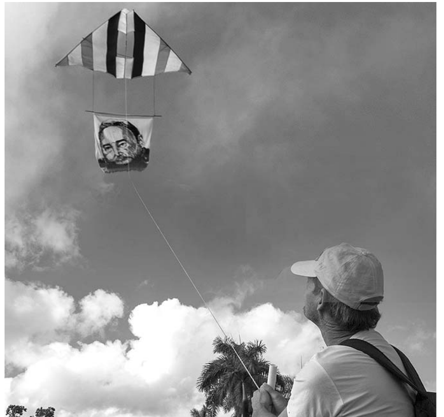
Universitarios recortaron del dolor para componer un mosaico, mientras Moisés no dejó a bolina, porque su papalote se empina con Fidel.