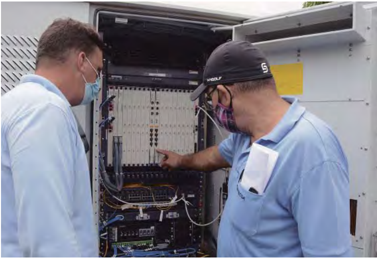
POR JORGE ENRIQUE JEREZ BELISARIO

Los nuevos gabinetes telefónicos se instalaron recientemente en el reparto Torre Blanca y el consejo popular Edén-Juruquey, de la ciudad de Camagüey, con los que se pretende mejorar la calidad del servicio, optimizar el uso de las centrales y dar respuesta a los traslados telefónicos pendientes.