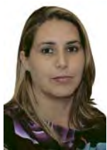
POR YANISLEIDY PRADO ROJAS

El municipio de Camagüey es uno de los que mayor número de pacientes positivos de dengue tiene en el país, y el de la tasa más elevada en la provincia. Eso nos pone alertas a todos, pues bien sabemos que las lluvias de los últimos días favorecen la aparición del mosquito Aedes aegypti y cualquiera puede ser víctima de la enfermedad.