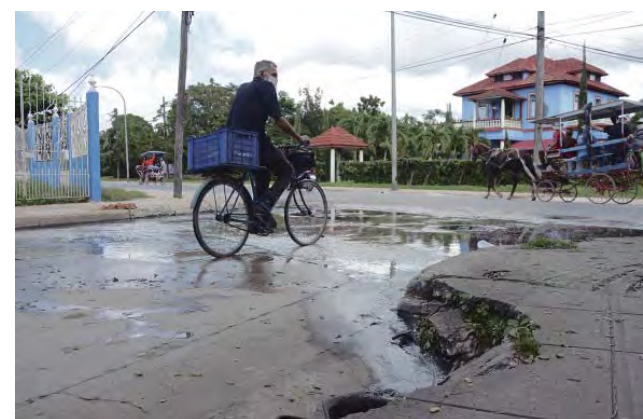
Y en la esquina de Ojo de Agua y la Carretera Central se suma a la calle y la acera rotas, este surtidor de aguas limpias y sucias y malos olores de todo tipo.