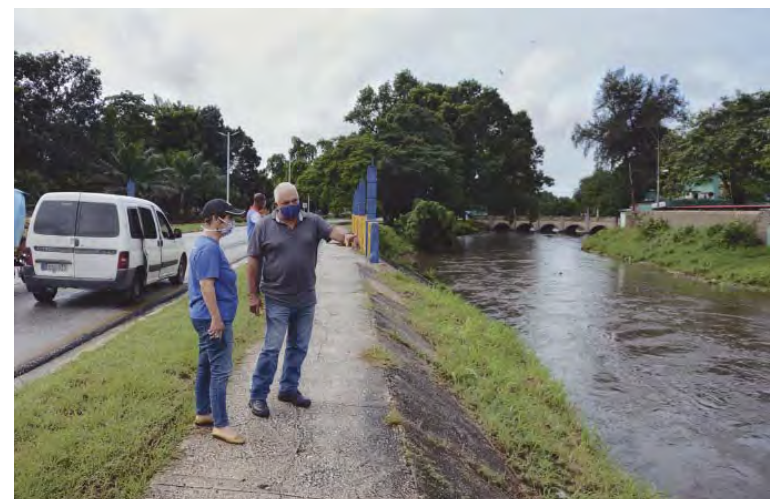
Durante la jornada del pasado domingo la tarea principal del subgrupo de Agua del Consejo de Defensa Provincial (CDP) resultó la vigilancia del comportamiento del escurrimiento en la ciudad por las lluvias aguas arriba.

"Sin embargo, después que tocó tierra debido a las fricciones y rozamiento, las condiciones lo debilitaron. Al salir al mar