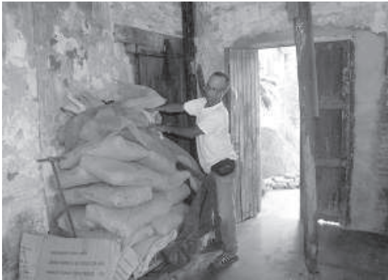
El presidente del consejo popular América Latina explica que en la medida que avanza los trabajos se le suministra los materiales a la beneficiaria de San Ramón 72.

“Me dijeron que esperara, avisarían a la casa. Como los materiales se estaban acabando, fui al Poder Popular municipal, vi a la compañera que atiende a la población y le hice la historia del tabaco completa, pero nada. Nos han llenado tres expedientes, el último, con número 63 del 2014, no sé qué destino cogió; sigo sin recibir ningún