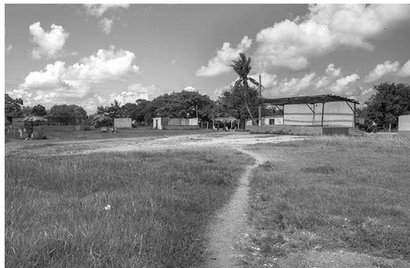
Este terreno, epicentro del pueblo, cambiará su imagen para complejo Arcoiris.