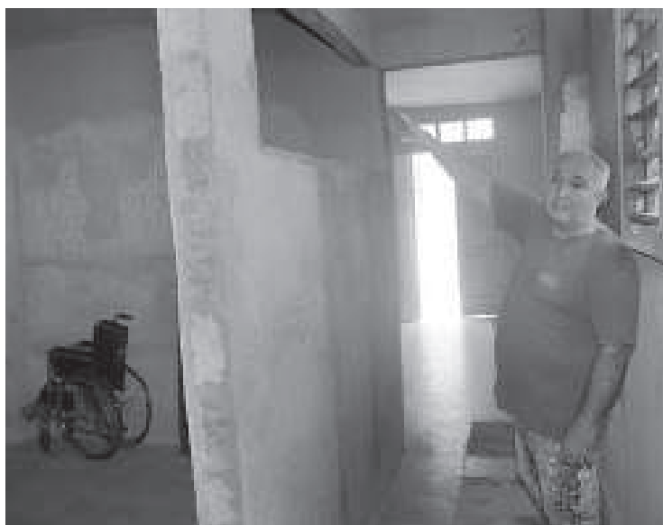
Vecino de San Esteban 717 sufrió derrumbe total en parte de su vivienda, pero las labores avanzan, aunque faltan algunos materiales.