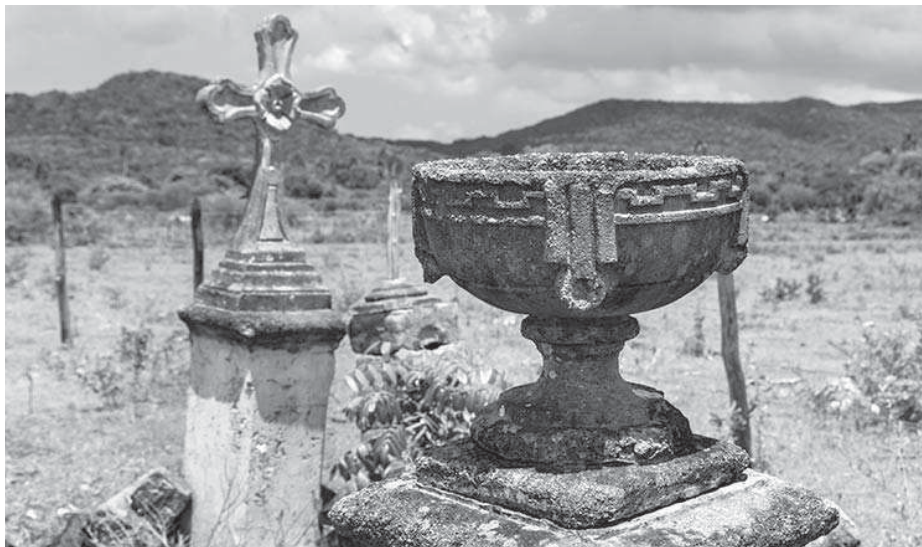
Siempre impresiona el encuentro con cruces y tumbas que, en solitario, han dado origen a no pocas leyendas y fantasmas.