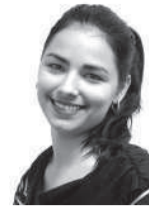
Por Lisyén Halles Ravelo

Por más que averiguo y abundo sobre el tema no encuentro una sola causa indicativa de que lo correcto sea procrear antes de los 20 años. La promoción y educación para la salud no solo debe llegar a las escuelas en teoría, sino practicarse, abordar el tema sin tapujos, y qué decir de casa, ahí, en familia, cuando se ofrecen ejemplos de amor, entrega y una buena comunicación, todo fluye más fácil. Hay que saber dónde están los hijos, con quienes se reúnen, y aunque como todo ser humano deben vivir sus propias experiencias, al menos, con la información de cuáles son los riesgos a los que se exponen.