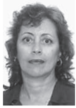
Por Olga Lilia Vilató de Varona