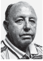
Por Enrique Atiénzar Rivero

De las 20 entidades sometidas a examen durante la décimo segunda comprobación nacional de control interno, tres pasaron la prueba de fuego: la Empresa Provincial de Turismo de Ciudad Santa María y las Unidades Empresariales de Base Acueducto y Alcantarillado, de Vertientes, y la Empresa Eléctrica en Guáimaro.