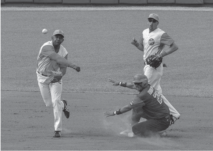
El estelar torpedero de La Guernica es el único jugador agramontino que está con Granma en la Serie del Caribe de Guadalajara, México.

2- La baja cantidad de cuadrangulares y extras marca esta edición de la Provincial. Según