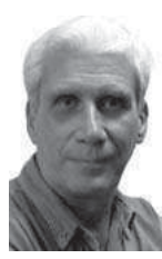
Por Rolando Sarmiento Ricart

La medicina para combatir la chapucería, germen para las ilegalidades, es perfeccionar la aplicación del control interno, desde la mirada preventiva de los miembros de los consejos de dirección hasta llegar al último trabajador. Ojalá que los directores de empresas, representantes de los órganos locales del Poder Popular, economistas y especialistas de otras ramas relacionadas con el ejercicio, asistentes al resumen, hayan salido con esa convicción.