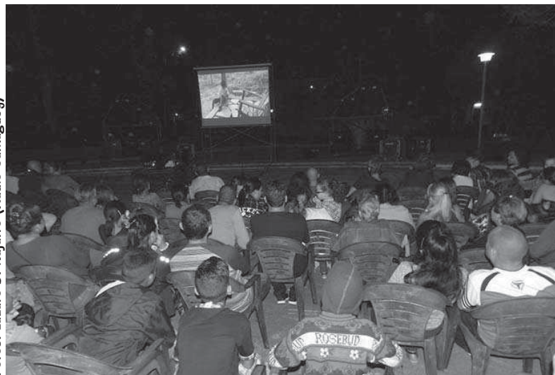
Exhibición de "La caleta" en el parque de Santa Cruz del Sur.