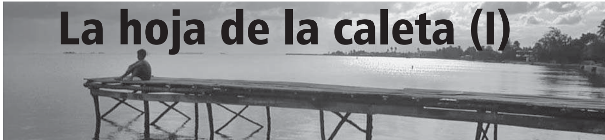
Fotogramas del filme

•El viernes 23 de enero ocurrió el estreno de La hoja de la caleta en Camagüey. Fue justo en el pueblo donde se filmó. La película, dirigida por Mirta González y Jorge Campanería está en la cartelera de la sala de video Nuevo Mundo y del multicine Casablanca. Adelante convida a apreciarla como proceso y no como resultado, porque el cine es compartir