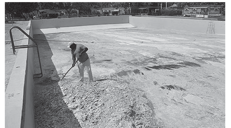
Nunca antes la piscina de Carlos Manuel de Céspedes se había sometido a una labor tan intensa.