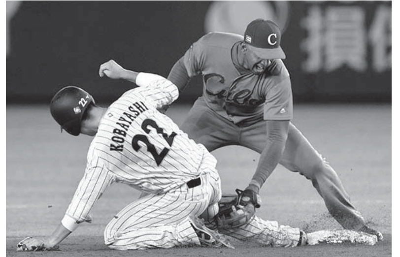
Durante el último año el "cuatro" de los Toros se ha confirmado como uno de los hombres imprescindibles para los equipos camagüeyano y de Cuba. Su éxito en la Can-Am no hace más que confirmarlo.

De la misma, lo más significativo ha sido la utilización de varios hombres en diferentes posiciones, el ensayo de nuevas rotaciones y el trabajo en condiciones de competencia que pudo asumir el cuerpo de pitcheo. En las primeras fechas sobresalió la cerrada victoria agramontina de 4-3 frente a Ciego de Ávila. De acuerdo con declaraciones del comisionado Leonel Moa, luego de la "Eddy Martin" la preselección espera asistir a un torneo organizado en Santiago de Cuba, durante la semana que comienza.