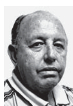
Por Enrique Atiénzar Rivero

Su figura y pensamiento emergen por doquier y son asumidos por el pueblo cubano en el quehacer diario, en la defensa de la soberanía, en el ejercicio del internacionalismo proletario, como trinchera antiimperialista, en nuestra cultura, en disímiles rincones de la Patria, pero siento que aún no todos sabemos cobijarnos bajo su sombra protectora.