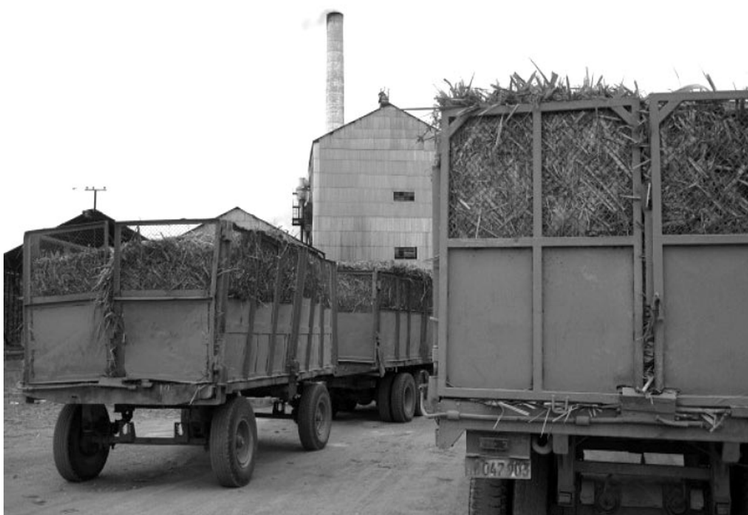
El 60 % de la caña consumida por el ingenio ha sido mediante el tiro directo al basculador.