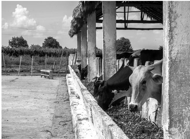
"El futuro en 'Niña bonita' es hacer cuarterones y dar la proteína en el potrero", avizora Chacón.

"Tenemos un plan de ocho ha. para las plantas proteicas, y llegaremos a 13.42, que no basta. Debemos plantar 34 ha. para suplir la alimentación de toda la masa, que son unas 1 200 cabezas. Por ahora, la prioridad para el consumo de 'proteicas' es de los toros de ceba y las vacas lecheras", apunta Raidel.