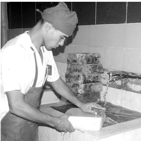
El queso Cubanito, la especialidad de la casa.

El personal de mantenimiento hizo maravillas para reparar la caldera, los condensadores, y poner de alta los camiones, indispensables para el trasiego de la leche y que la "Taíno" no pierda cualidades con el empuje de la nueva dirección, que ha revolucionado el control, elevándolo para que la eficiencia y la eficacia sean dos pilares en la gestión económica, además del insustituible papel de los trabajadores.